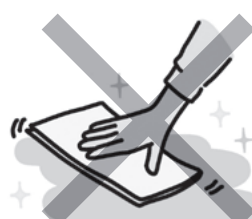
掃除などの家事全般