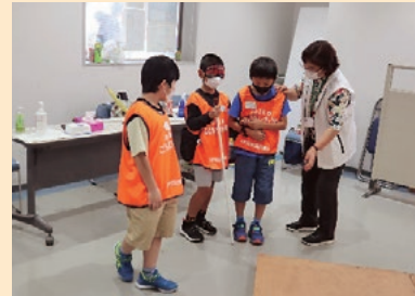
アイマスク・白杖体験指導の様子

ボランティア活動がはじめての方や福祉のお仕事が未経験の方も、職員と指導ボランティアとして活躍されている方達が、しっかりサポートしますので、ご安心ください。