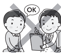
手術等の医療行為の決定及び同意