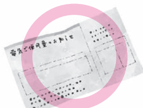
公共料金等の支払い